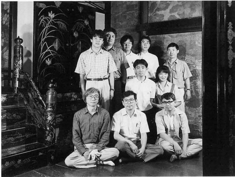
挿図3 調査時のひとこま（高台寺にて）

いっぽう、悉皆調査をまがりなりにやって得た感慨のひとつに、既調査の報告は参考になるが、その報告に出てこない物件も少なくないということがある。調査の目的の違いや時間的制約からそうなるに違いなく、さらには、調査者の専門が異なり関心も変化しているからであろうし、宗教的な事情もあろう。評価については後人の判断するところとして、ここで少なくともいえるのは、調査はいつたん済めば終わりといかないということである。将来の調査者が『京都社寺調査報告』をどのような気持ちで読むであろうか。